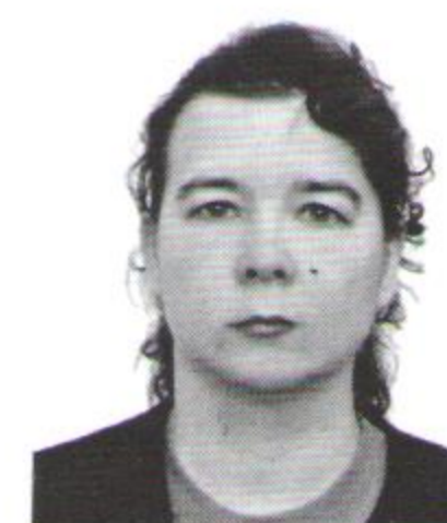
ОБРАЗОВАНИЕ В СОВРЕМЕННОЙ ШКОЛЕ

В проектной работе было предложено создать архитектурные модели из бумаги (Рис.1-4) для знакомства с темами: «Архитектура исторического города» и «Архитектура современного города» обучающимся 9 класса.